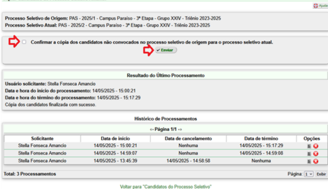
Figura 2- Copiar Candidatos de Processo Seletivo Anterior

É necessário marcar a confirmação de que os candidatos serão copiados e então clicar em “Enviar”, a ferramenta então será executada, basta aguardar a finalização.