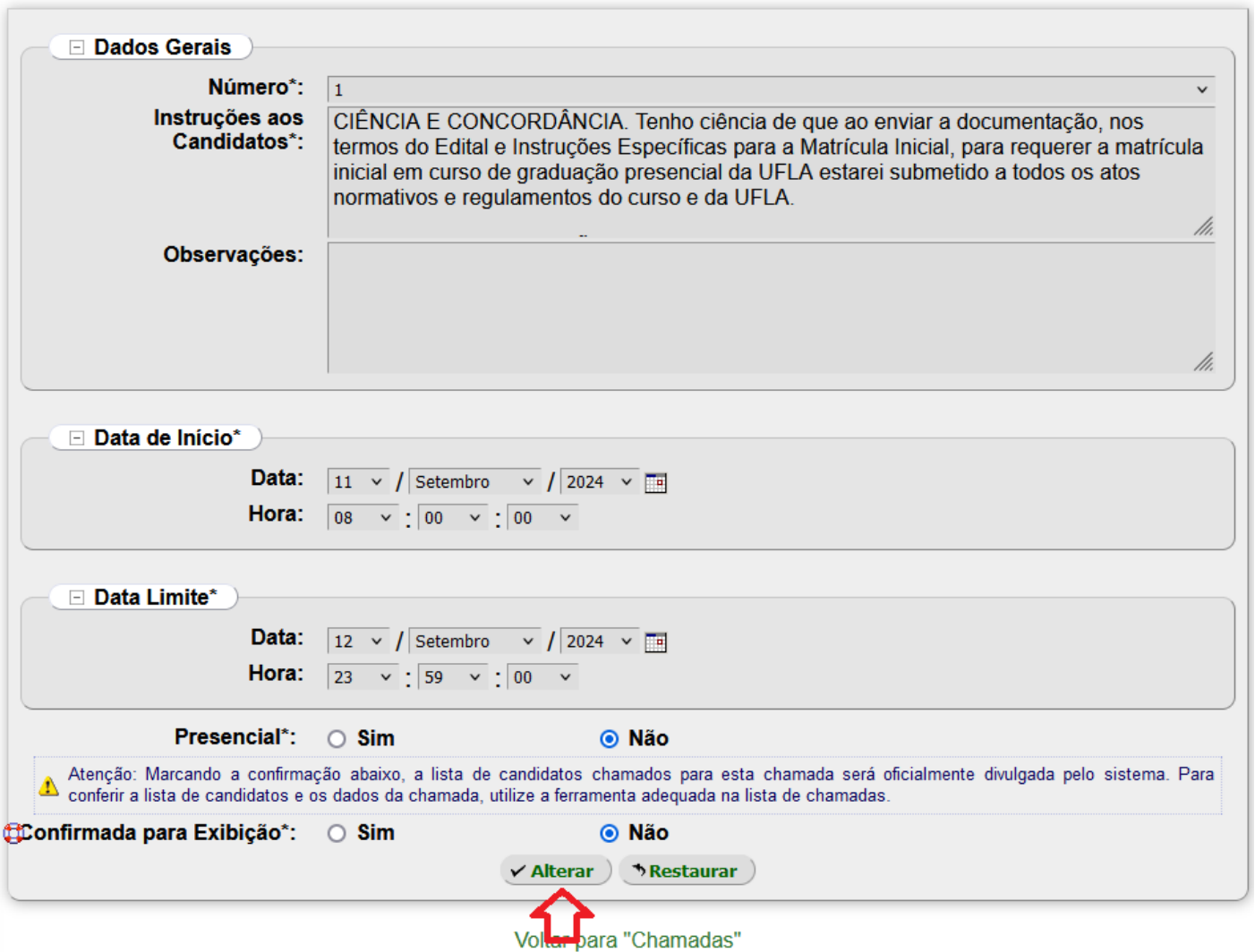
Figura 3 - Tela "Alterar Chamada"

Para confirmar a divulgação da lista de candidatos, e com isso a visualização da lista de convocados "fora" do SIG, basta marcar o checkbox "Confirmo que a lista pode ser divulgada" e clicar em "Confirmar".